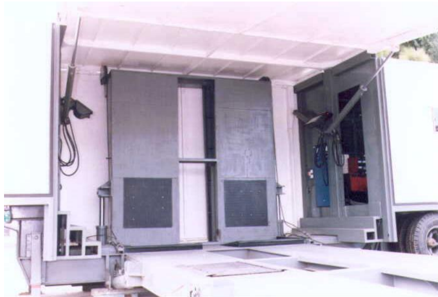
VISTA PARCIAL INTERIOR