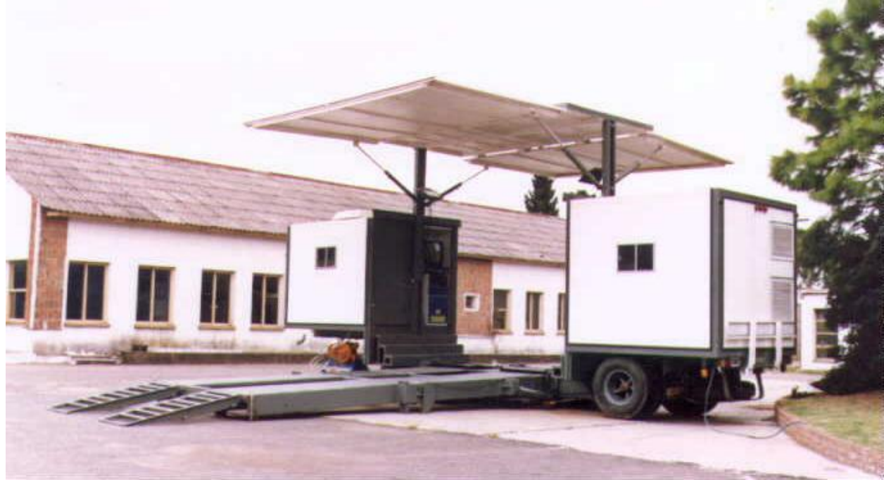
VISTA DE LA PLANTA ABIERTA

Buy Now to Create PDF without Trial Watermark!!