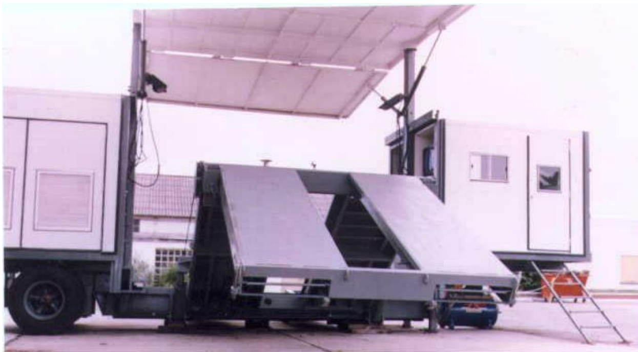
VISTA DE LA PLANTA ABRIENDOSE