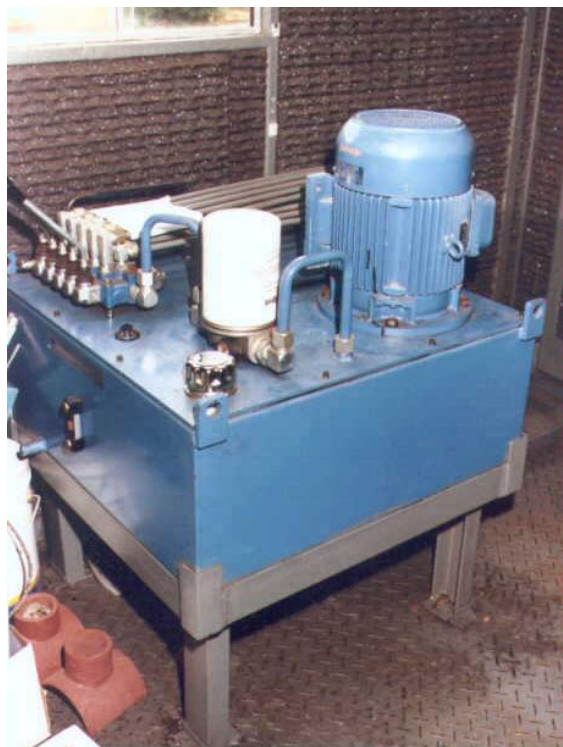
SALA DE MAQUINAS, BOMBA DEL MEDIDOR DE HOLGURAS